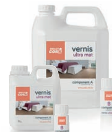
1L - 5L ULTRA MAT