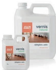
1L - 5L NATUREL