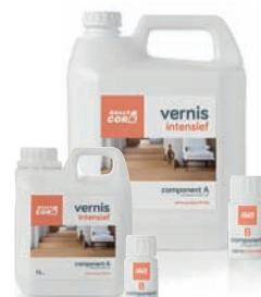
1L - 5L INTENSIF