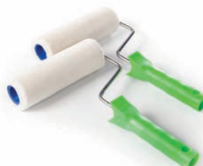
ROULEAUX COLLES - VERNIS