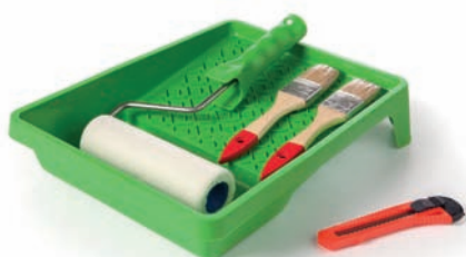
OUTIL DE POSE COLLES - VERNIS