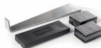
OUTIL DE POSE CLIC