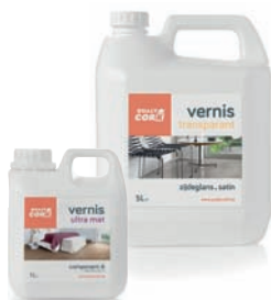
1L - 5L TRANSPARENT