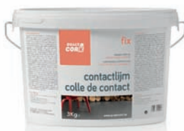
10Kg - 3Kg FIX